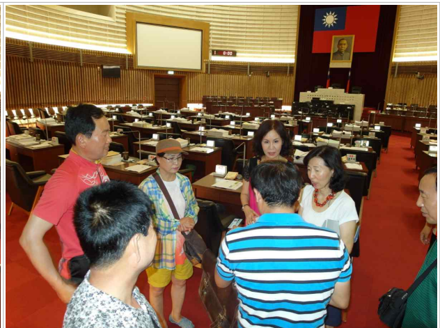
의회장 안내 및 설명